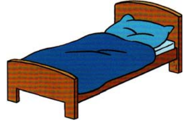
Voor het slapen