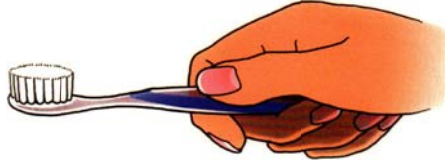
Een tandenborstel met zachte haren