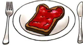
Na het ontbijt