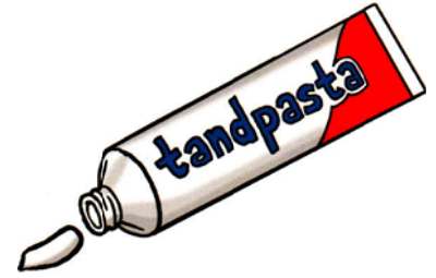
Een klein beetje tandpasta